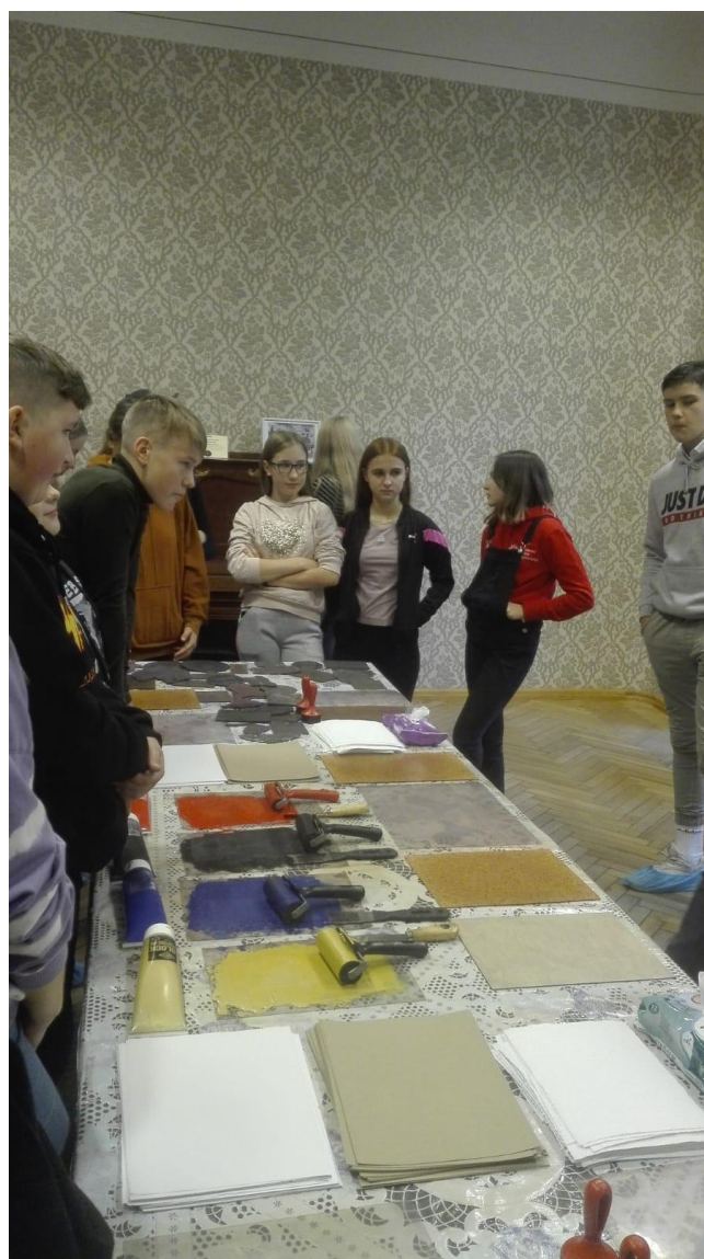
(“Grafikas darbnīcas apmeklējums”, skolotājas I. Gailītes foto.)